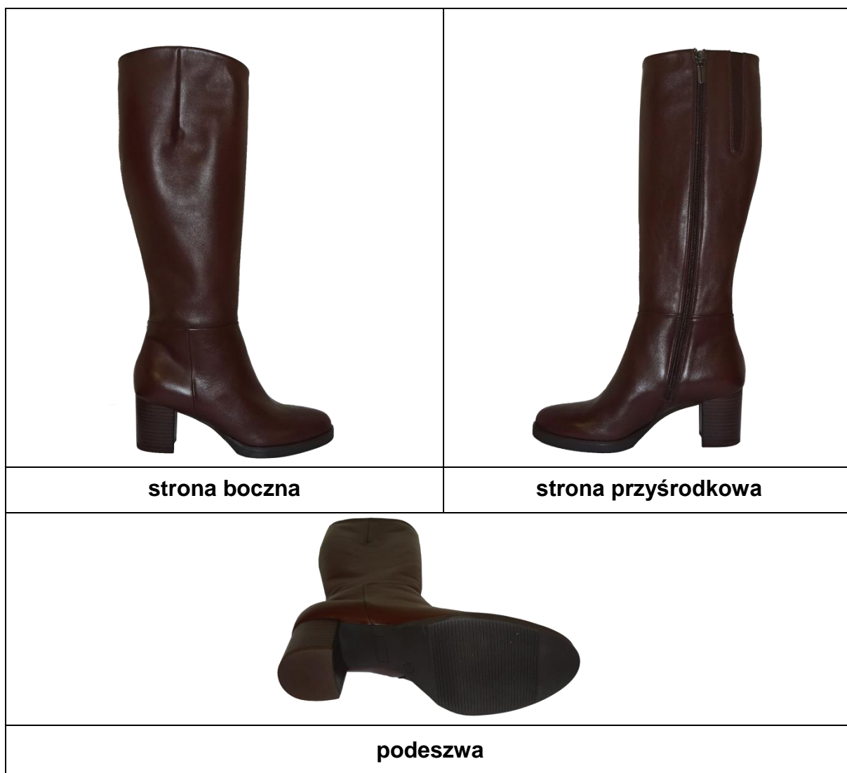
Fot.1 Wzór kozaków damskich do munduru wyjściowego