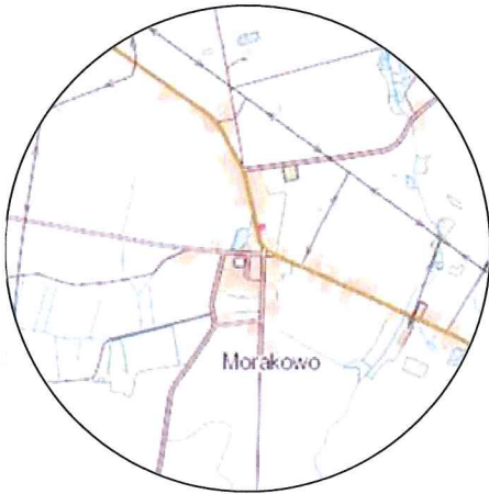
Szkic orientacyjny 1:25000

Poświadczam, że niniejszy dokument został opracowany w wyniku prac, których rezultaty zawiera operat techniczny wpisany do ewidencji materiałów państwowego zasobu geodezyjnego i kartograficznego.