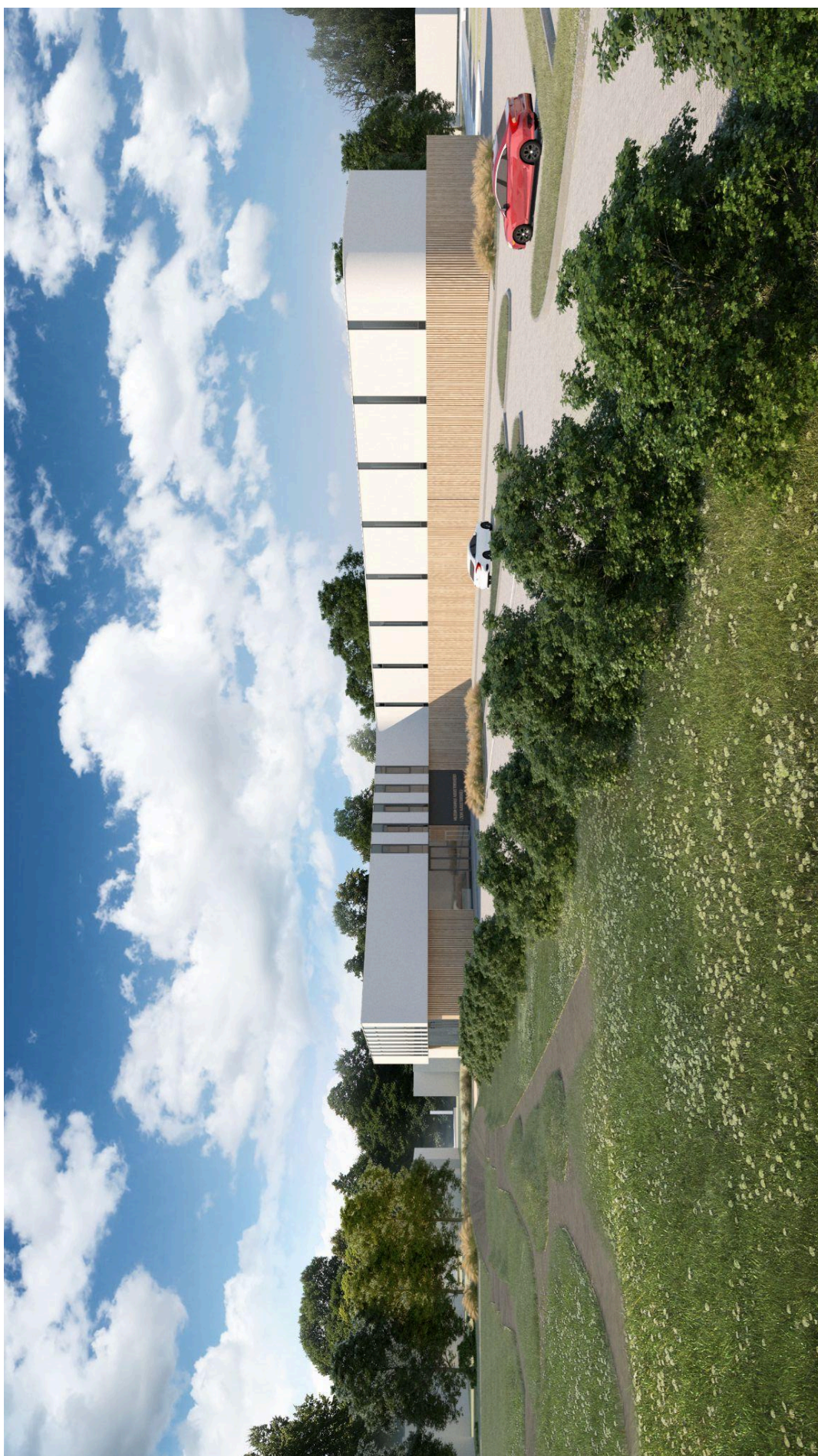
WIZUALIZACJA 03_ Widok od strony północno-wschodniej