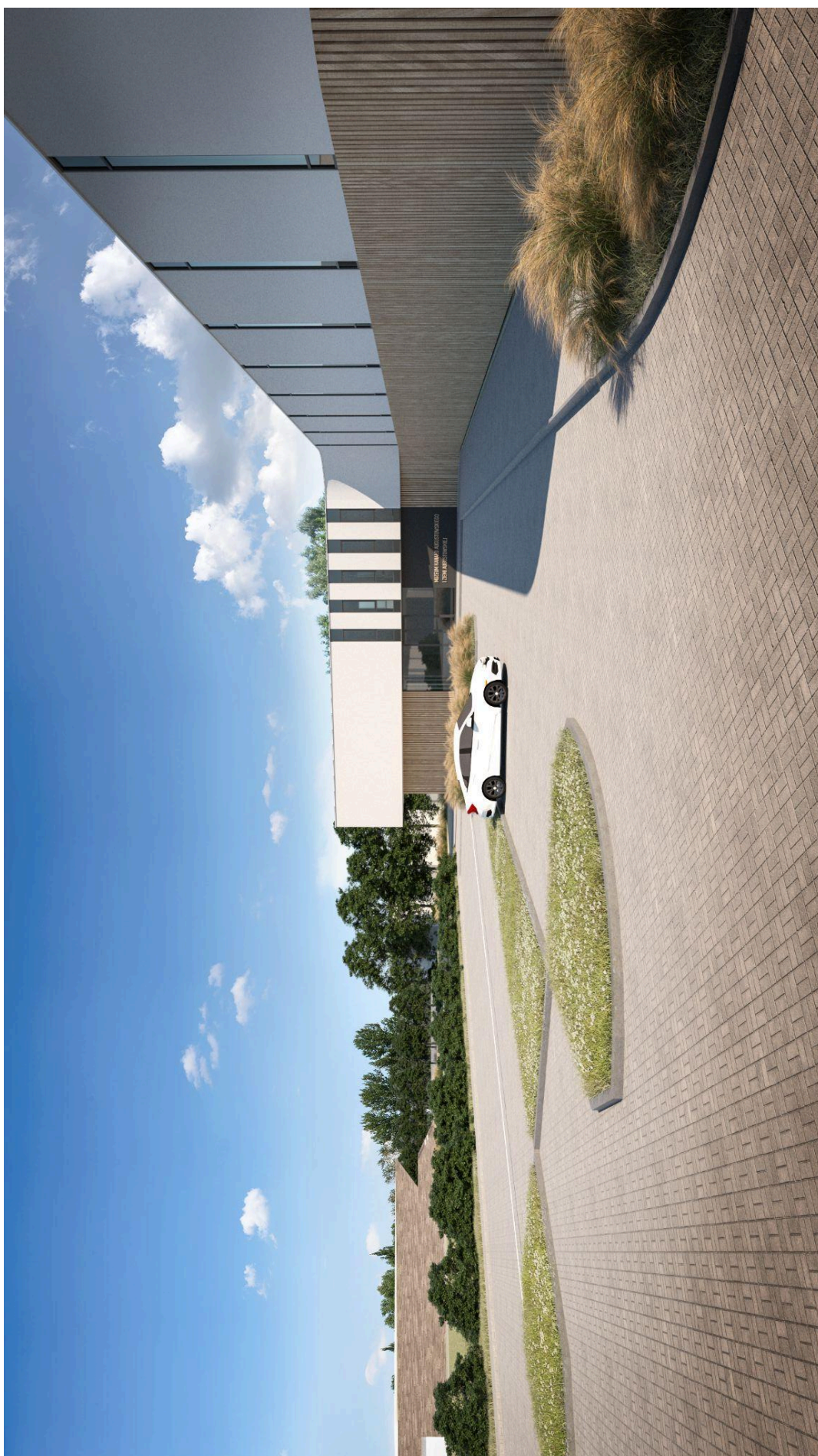
WIZUALIZACJA 02_ Widok od strony północnej