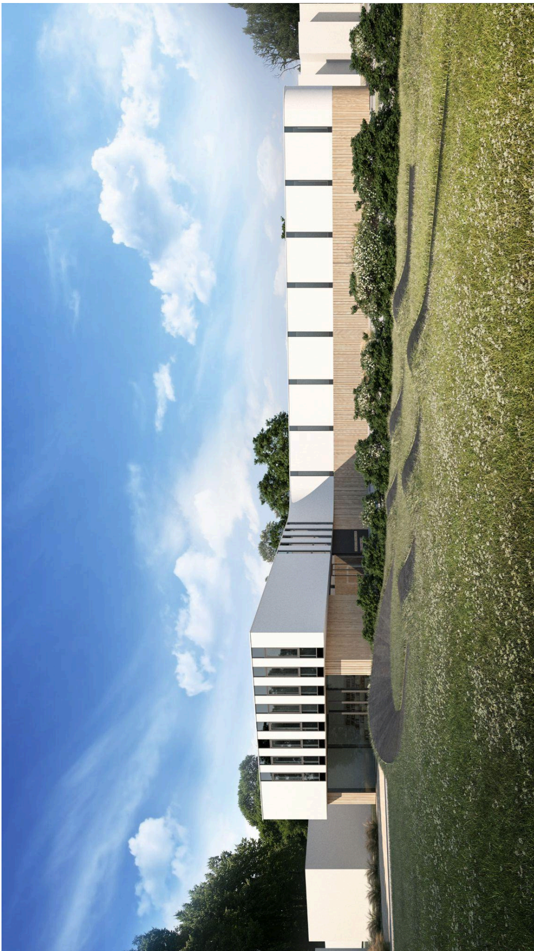
WIZUALIZACJA 02_ Widok od strony północno-wschodniej