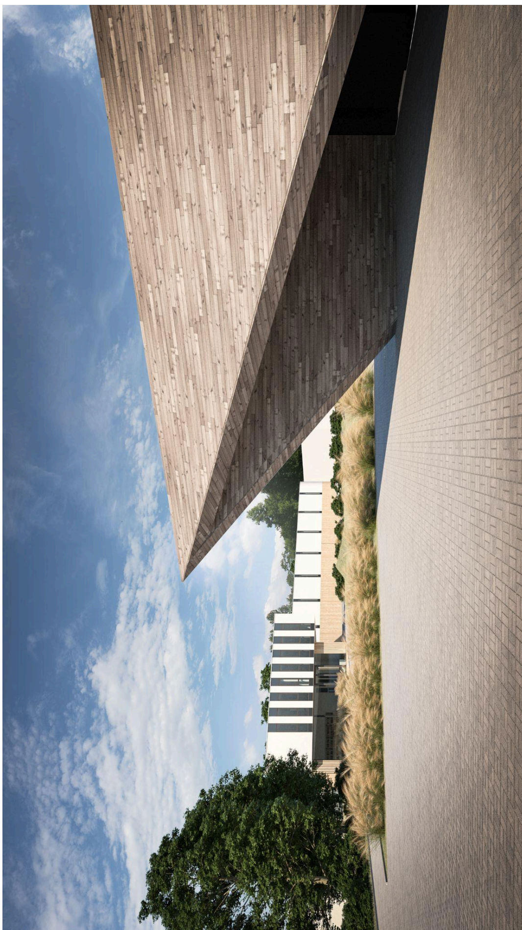
WIZUALIZACJA 01_ Widok od strony południowo-wschodniej