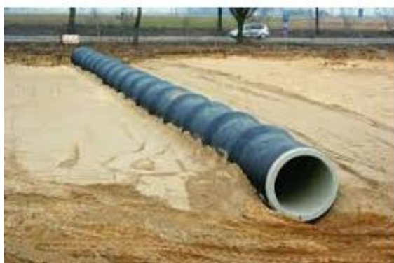
Fot. 6. Zmontowana część przelotowa przepustu