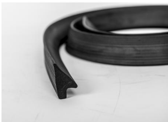
Fot. 5. Przykład uszczelki „klinowej”