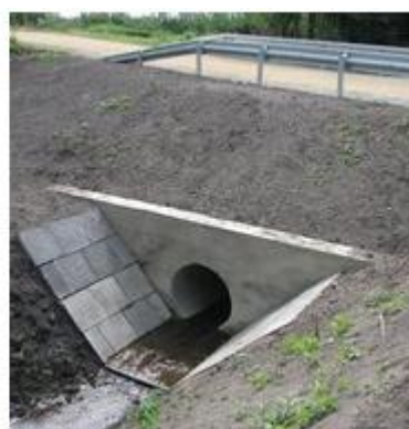
Fot. 8. Przykłady umocnienia skarp i dna rowu w sąsiedztwie wylotu przepustu