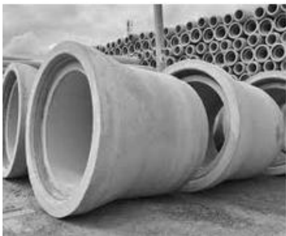
Fot. 4. Przykład prefabrykatu rurowego z kielichem ukształtowanym w formie zamka