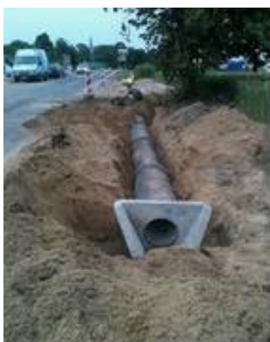
Fot. 7. Przepust z zamontowanym elementem wylotu