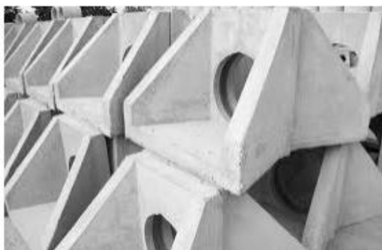
Fot. 2. Przykład prefabrykowanej ścianki wlotu przepustu ze skrzydłami