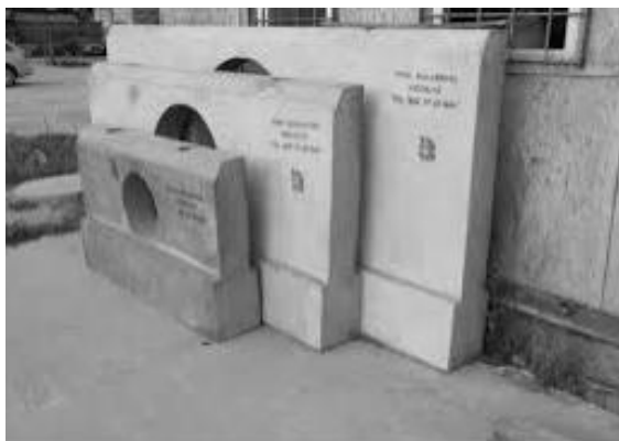
Fot. 1. Przykład prefabrykowanej ścianki czołowej przepustu