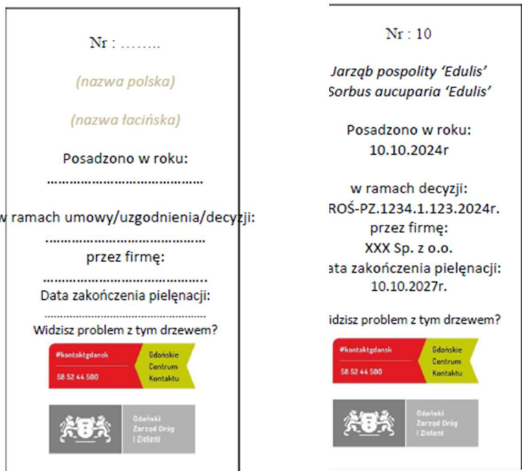
Fot. nr 1 – zdjęcie poglądowe oznakowania nasadzeń

Na tabliczce należy również umieścić nr porządkowy drzewa lub oznaczenie zgodne z dokumentacją projektową